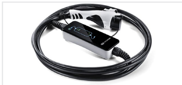
Kabel do ładowania