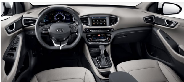
BEŻOWE (białe akcenty)