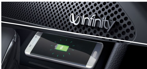
Ładowanie bezprzewodowe i nagłośnienie Infinity