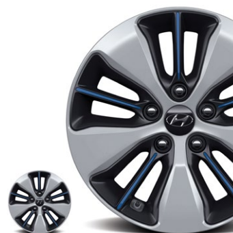
Srebrne z niebieskim akcentem