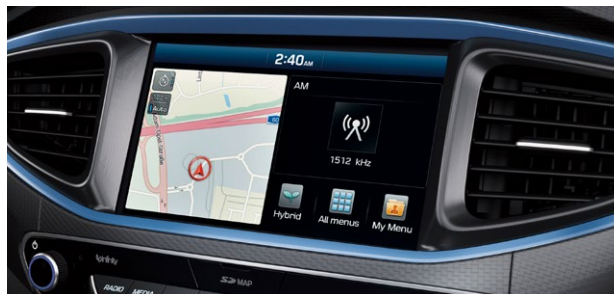
Nawigacja z 8" ekranem