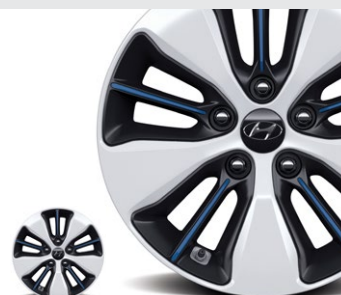
Białe z niebieskim akcentem