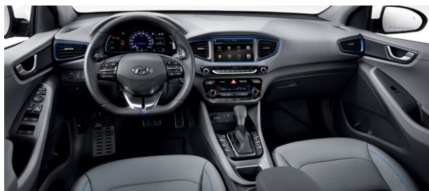
CZARNE (niebieskie akcenty)