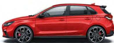
ENGINE RED (JHR)