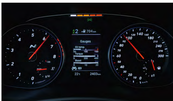
Sportowy zestaw wskaźników