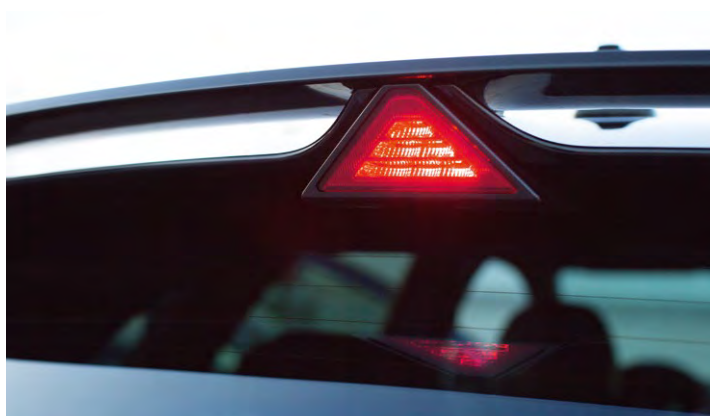
Tylne trójkątne światło STOP