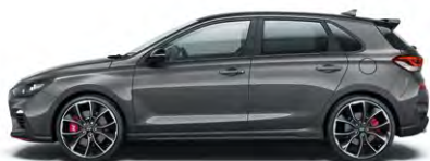
MICRON GREY (Z3G - METALICZNY)