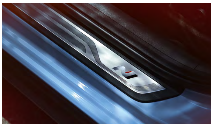
Nakładki progowe N