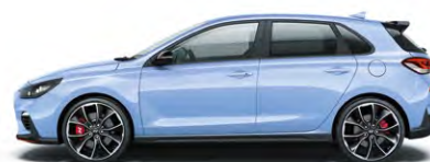
PERFORMANCE BLUE (XFB - SPECJALNY)