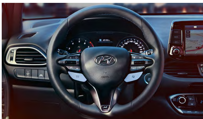
Sportowa kierownica pokryta perforowaną skórą