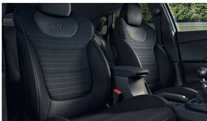
Tapicerka skórzana (elementy wykonane ze skóry ekologicznej i zamszu)