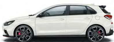
POLAR WHITE (PYW)