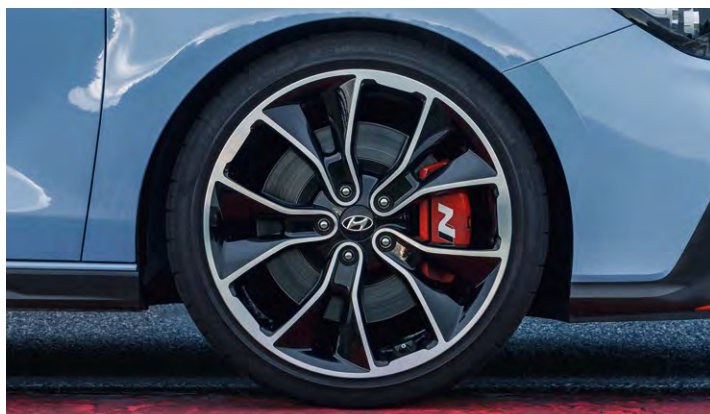
Felgi 19" z hamulcami N