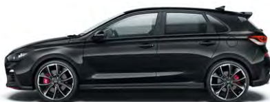
PHANTOM BLACK (PAE - PERŁOWY)