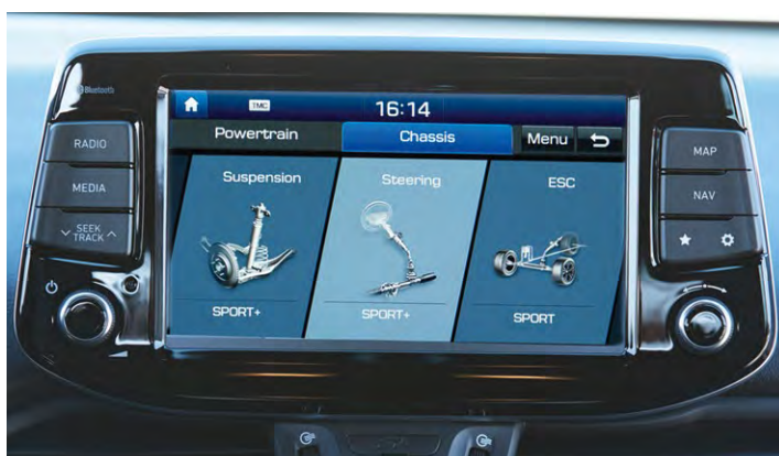
Nawigacja z trybem ustawień