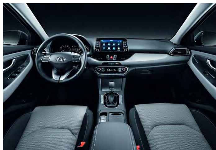
LIGHT SLATE GRAY (GSY)