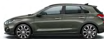
OLIVINE GREY (X5R - METALICZNY)