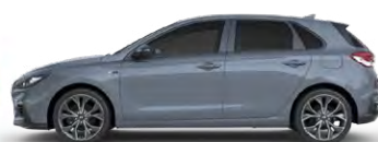
SHADOW GREY * (TKG - SPECJALNY)

* Kolor TKG dostępny tylko w wersji N-Line