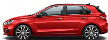
ENGINE RED (JHR - BEZ DOPŁATY)