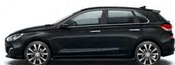
PHANTOM BLACK (PAE - PERŁOWY)