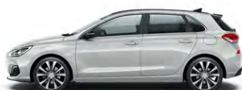
PLATINUM SILVER (U3S - PERŁOWY)