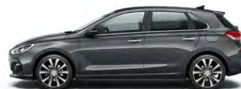
MICRON GREY (Z3G - METALICZNY)