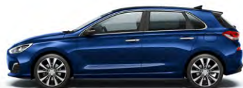
STELLAR BLUE (RWB - METALICZNY)