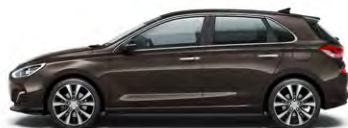
MOON ROCK (XN3 - METALICZNY)