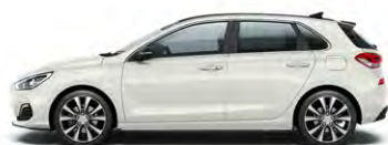
POLAR WHITE (PYW - BEZ DOPŁATY)