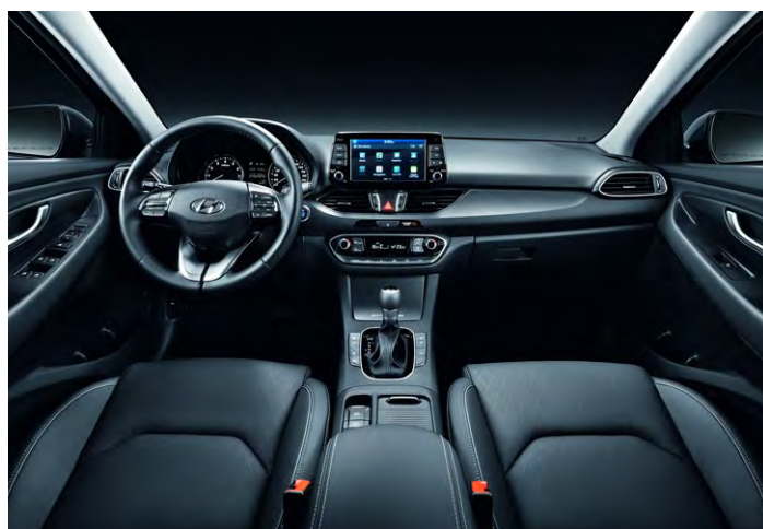
OCEANIDS BLACK (TRY)